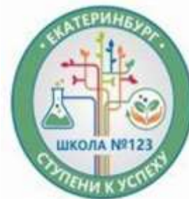
График работы приемной комиссии МАОУ СОШ № 123