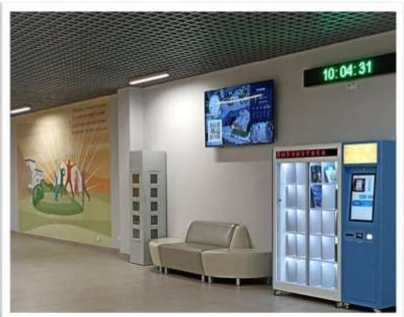
MAOY COLI N°123